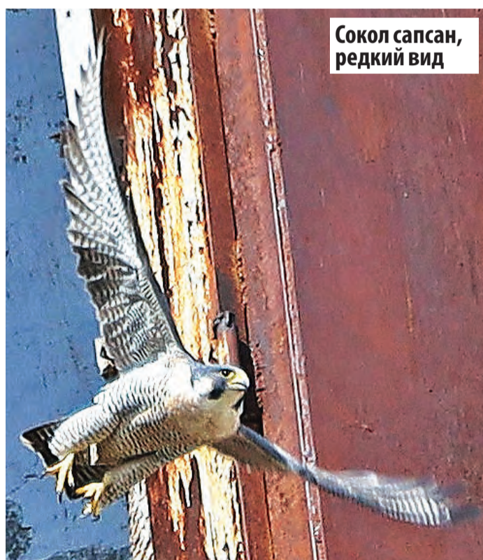
Соко́л сапсан, редкий вид

К таким обитателям городской среды как голуби и воробьи все мы давно привыкли. Однако здесь можно увидеть и более редких птиц. На озерах встречаются лебеди, из года в год выводят потомство утки. В небе над Волгой и Самаркой иногда можно заметить силуэт цапли. В отдаленных от центра районах, где есть леса и поля, над землей кружат хищники - соколы и коршуны. На территории города встречается даже редкий вид - сапсан. Предлагаем вам подборку уникальных снимков, сделанных нашим фотографом Владимиром Пермяковым. Благодарим специалистов Самарского зоопарка, которые помогли определить, «кто есть кто».