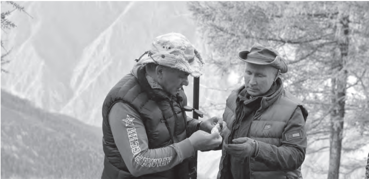
Алексей Дружинин / РИА Новости

та «Победа». На встрече лидеров Бразилии, России, Индии, Китая и ЮАР намечено рассмотреть состояние и перспективы стратегического партнерства в рамках объединения, в том числе совместные шаги по борьбе с распространением коронавирусной инфекции. Запланировано обсуждение актуальных вопросов международной и региональной повестки дня с акцентом на ситуации в Афганистане. Основные договоренности будут отражены в итоговой декларации.