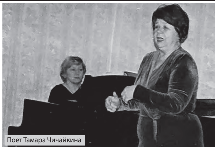
Поэт Тамара Чичайкина