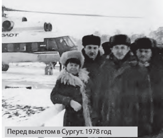
Перед вылетом в Сургут, 1978 год