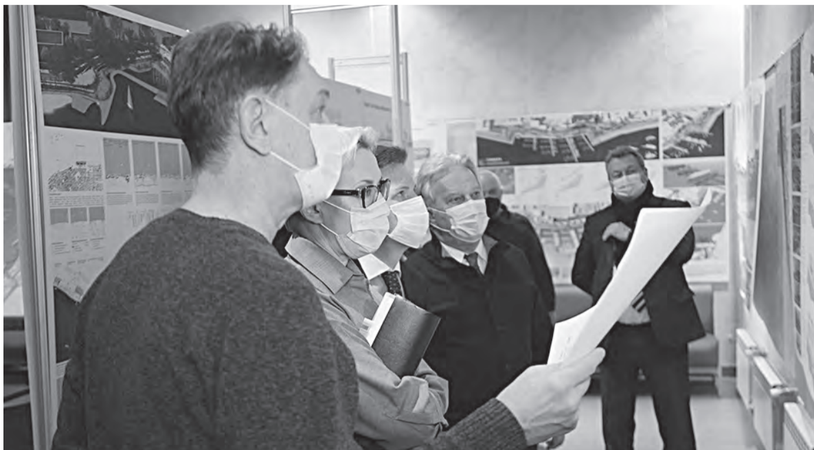
В Самаре выбрали лучшие концепции 5-й очереди набережной