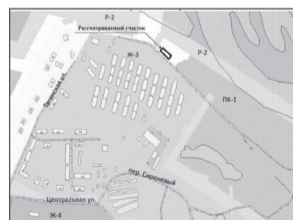
Рисунок 1. Пер. Сиреневый, 24 А с кадастровым номером 63:01:0407001:516 в Куйбышевском районе. Установление зоны Ж-1 (площадью 600 кв. м)

1. Пер. Сиреневый, 24 А с кадастровым номером 63:01:0407001:516 в Куйбышевском районе. Целевое назначение земельного участка по Карте градостроительного зонирования – не установлено. Установление зоны Ж-1 (зона застройки индивидуальными жилыми домами) (площадью 600 кв. м), согласно Рисунку 1 Приложения 3 к настоящему Решению.