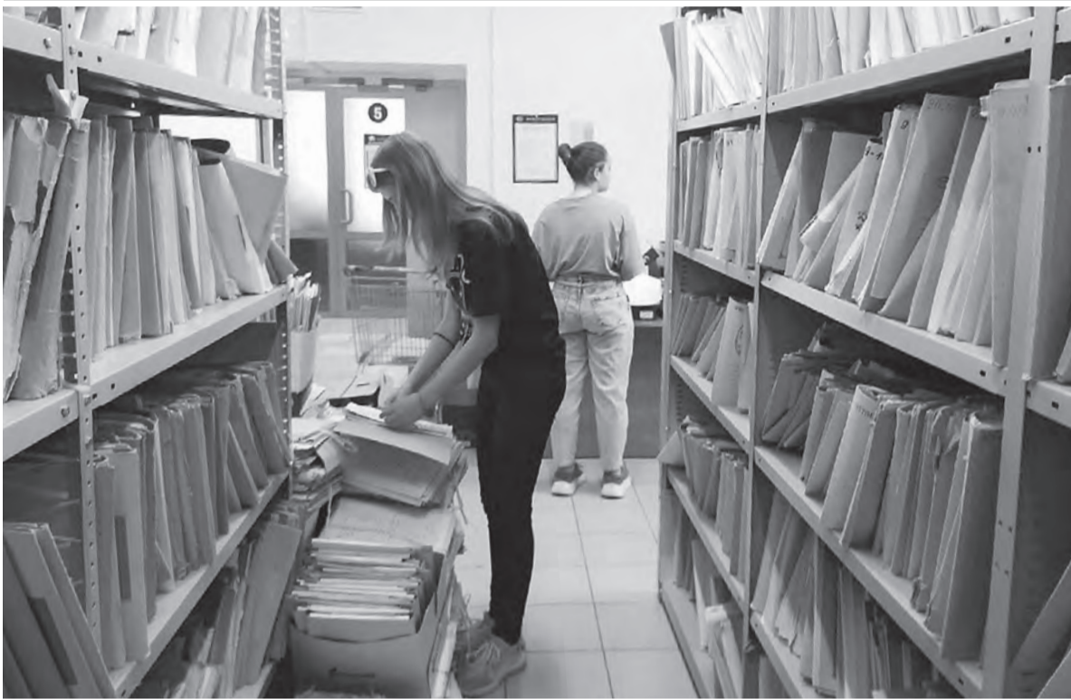
Молодежный центр «Самарский»

и без признаков заболевания). Вас проконсультируют по срокам трудоустройства и необходимому пакету документов.