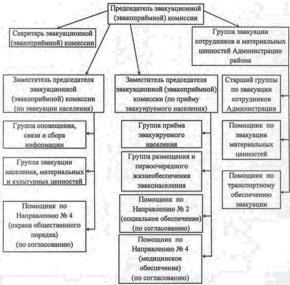
СОСТАВ эвакуационной (эвакоприёмной) комиссии Кировского внутригородского района городского округа Самара