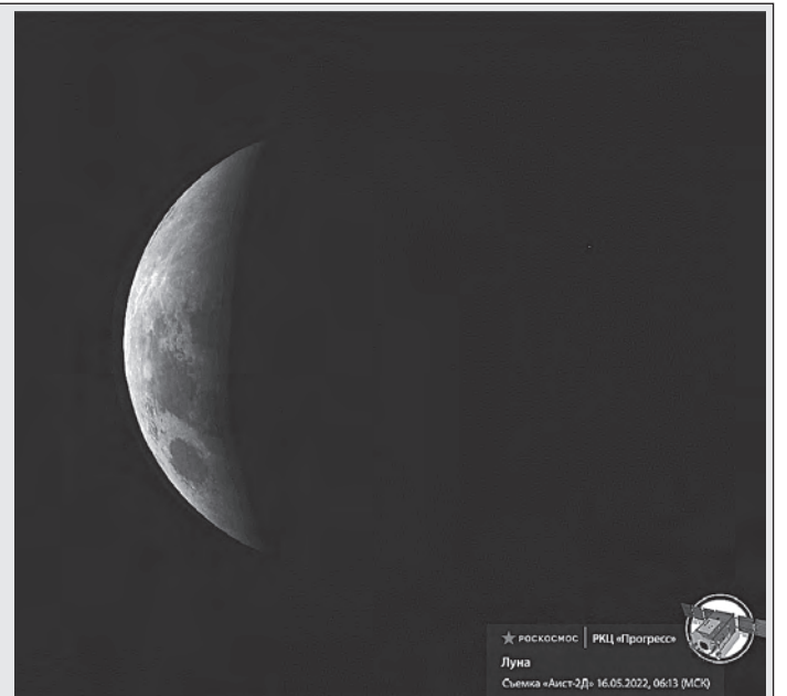
Луна Съемка «Аист-2Д» 16.05.2022, 06:13 (МСК)

В понедельник, 16 мая, диск Луны был полностью погружен в тень Земли в течение полутора часов. В России его было не видно. И специалисты РКЦ «Прогресс» поменяли ориентацию спутника #Аист2Д в сторону космоса, чтобы ему удалось запечатлеть момент полного лунного затмения с высоты 490 км.