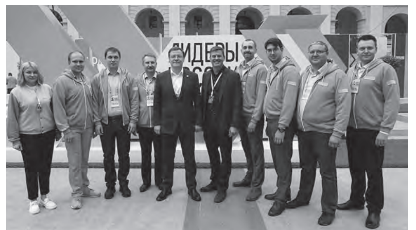
Суперфиналисты конкурса «Лидеры России» из Самарской области