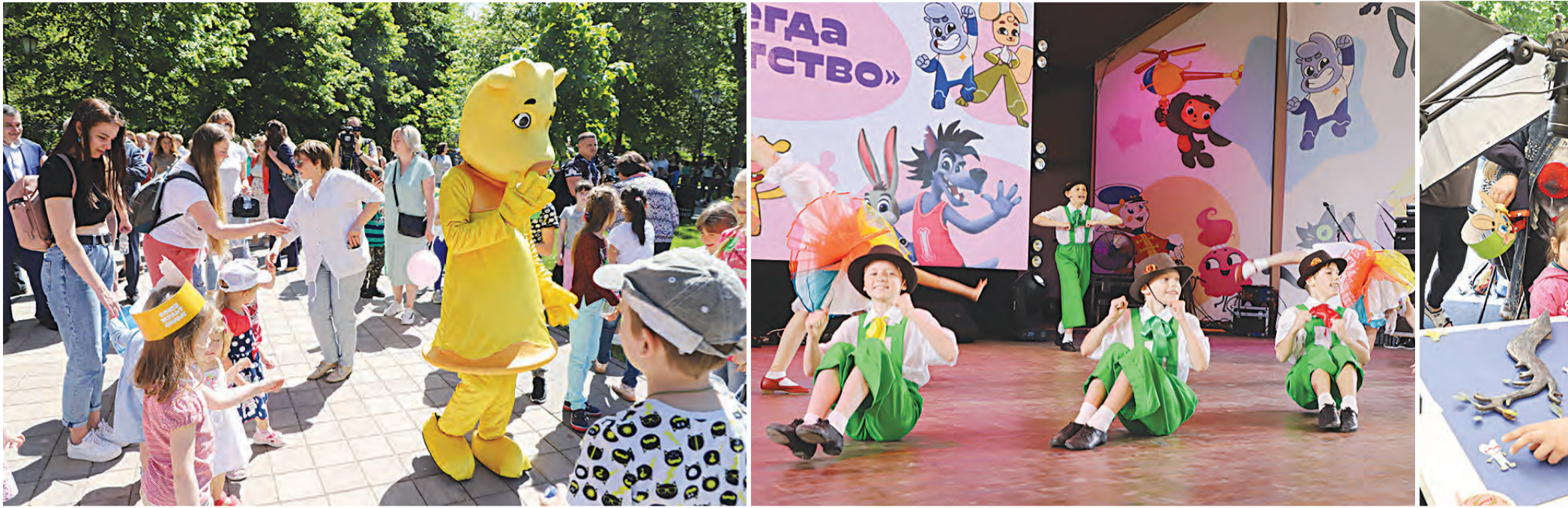
Фото с Громозекой и танцы с Крокодилом Геной

В Струковском саду прошел фестиваль «Пусть всегда будет детство»