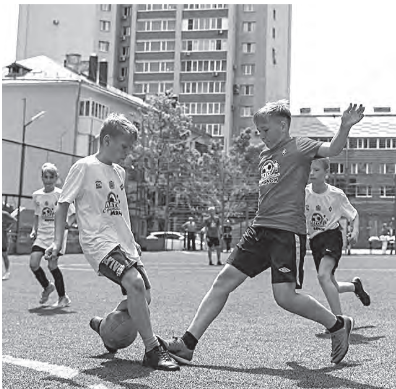
Максим Калинин / minsport.samregion.ru