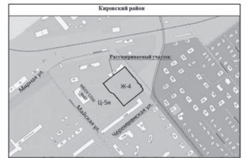
Рисунок 2. Улица Советская/улица Черемшанская с кадастровым номером 63:01:0227003:54, ул. Майская, дом 47 с кадастровым номером 63:01:0227003:849, ул. Майская, участок № 49 с кадастровым номером 63:01:0227003:3296, ул. Майская, д. 47, корпус А с кадастровым номером 63:01:0227003:3301 в Кировском районе. Изменение части зоны Ц-5н, ПК-1 (площадью 3925 кв. м) на зону Ж-4