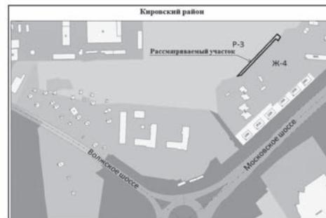
Рисунок 3. 18-й км микрорайон, Московское шоссе 18 километр в Кировском районе. Изменение части зоны Р-3 (площадью 723 кв. м) на зону Ж-4