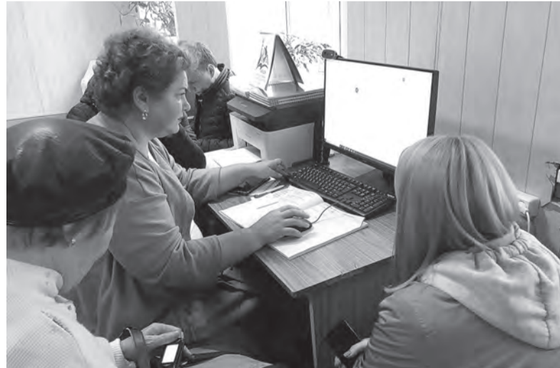
ГРАФИК РАБОТЫ ВЫЕЗДНЫХ ПУНКТОВ МФЦ В РЕСУРСНЫХ ЦЕНТРАХ «МОЙ ДОМ»

С вопросами по теме ЖКХ можно обратиться на горячую линию по телефону 8-800-55-55-263 (звонок бесплатный).