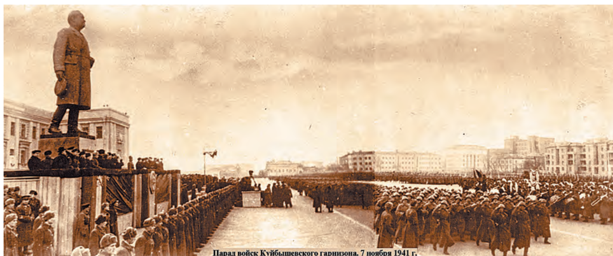
Парад войск Куйбышевского гарнизона. 7 ноября 1941 г.

Непридуманные истории, связанные с парадом 1941 года в Куйбышеве