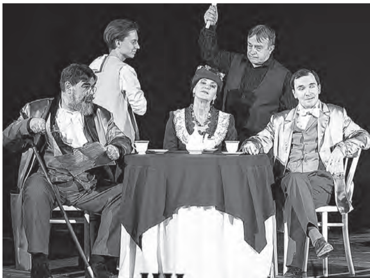
4 апреля, 18:30 «Лариса» (12+) по пьесе «Бесприданница»