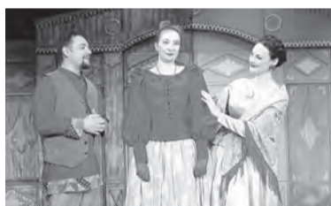
2 апреля, 18:00 «Не сошлись характерами» (12+)