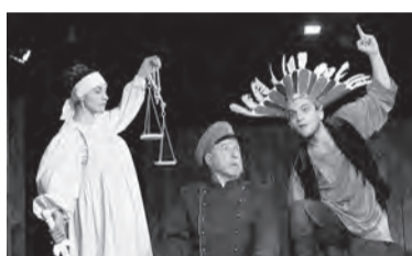
1 апреля, 18:00 «Горячее сердце» (12+)