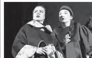
11 апреля, 18:00 «Гроза» (12+)