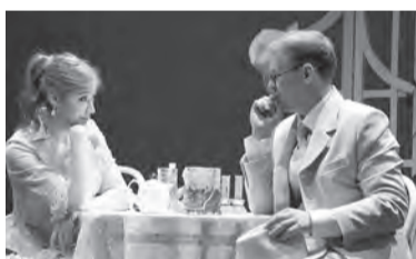
12 апреля, 18:30 «Богатые невесты» (12+)