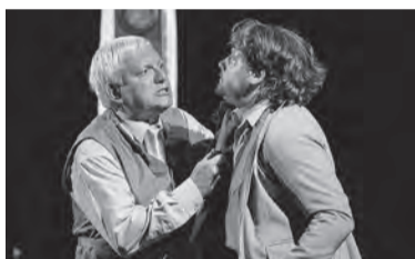
8 апреля, 18:00 «Олигарх» (12+) по пьесе «Не все коту Масленица»