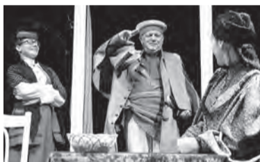
9 апреля, 18:00 «Правда - хорошо, а счастье лучше» (12+)