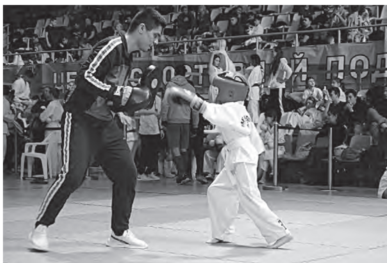
Центр дополнительного образования «Меридиан» Адрес: поселок Управленческий, улица Красногвардейская, 8. Телефоны: 950-00-87, 950-59-11.

го дети с ментальными особенностями просто сидели дома - не было тренеров, готовых с ними заниматься. А совместные уроки с обычными сверстниками, которые я несколько раз проводил, показывали, что общество не готово принимать не таких, как они. Сейчас ситуация на-