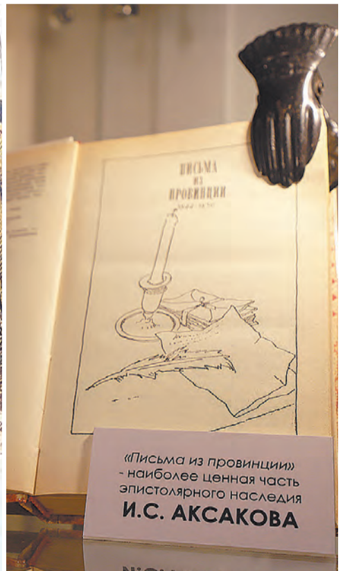
«Письма из провинции» - наиболее ценная часть эпистолярного наследия И.С. АКСАКОВА