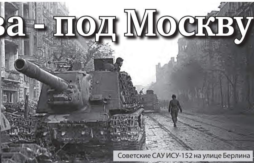
Советские САУ ИСУ-152 на улице Берлина