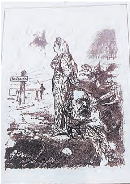
— Мана! «далой! далой!»...

В заключение юбилейных событий 9 октября в окружном Доме офицеров состоялся литературный вечер «Он верил в Россию!», на котором прозвучали романсы русских композиторов на стихи Ивана Сергеевича Аксакова в исполнении самарских исполнителей и музыкантов.