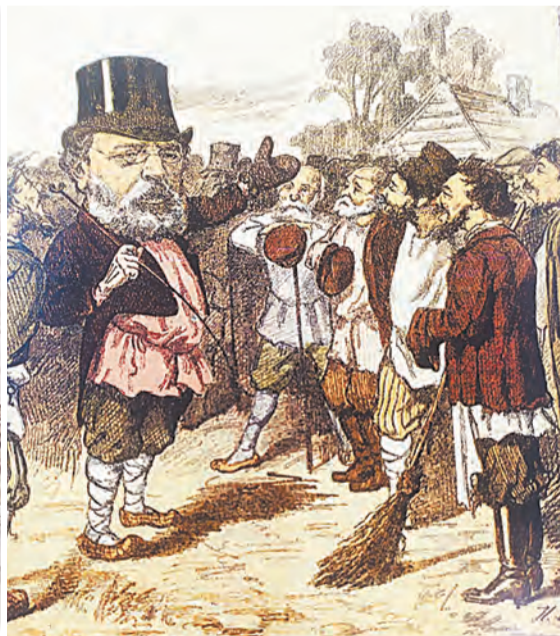
51. Н. П. Чехов Не то западник из народа, не то русский мужик с Запада! Карикатура на И. С. Аксаков. 1881. Литография