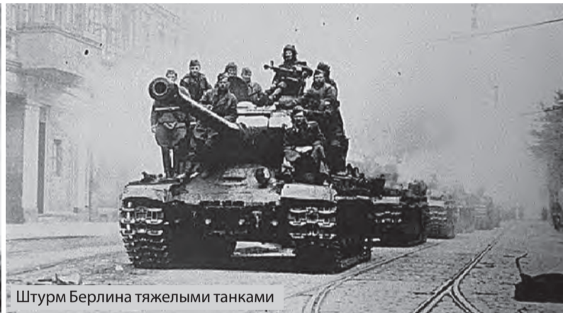
Штурм Берлина тяжелыми танками