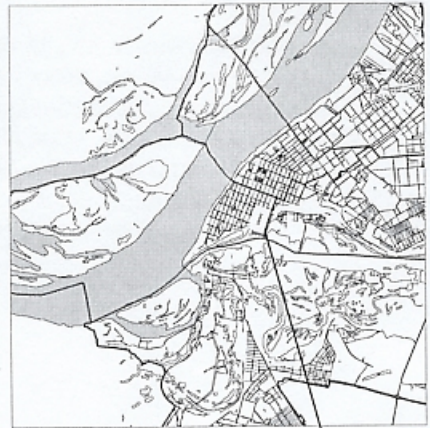
границы испрашиваемой территории